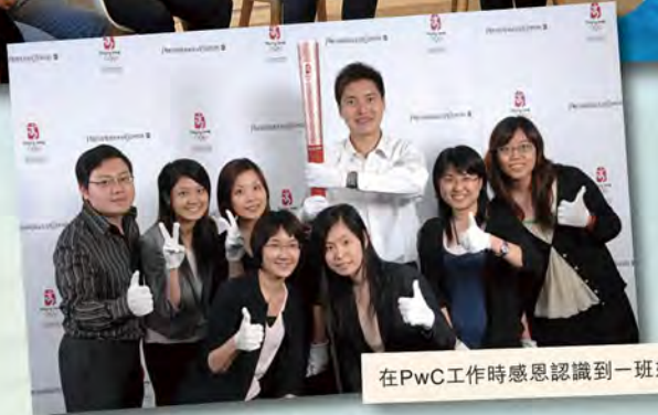
在PwC工作時感恩認識到一班好友