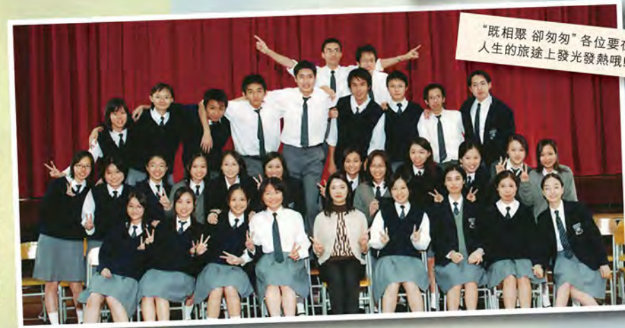
“既相聚 卻匆匆”各位要在人生的旅途上發光發熱哦！