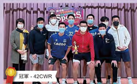
冠軍 - 42CWR