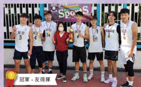
冠軍 - 友得揮