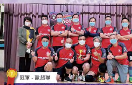
冠軍 - 歐超聯