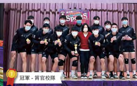
冠軍 - 筲官校隊