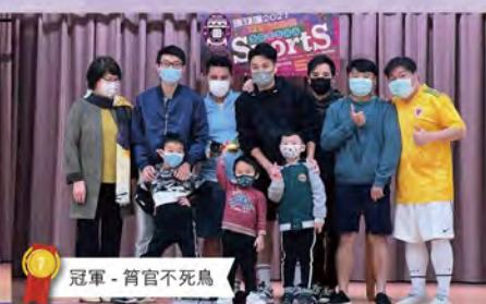
冠軍 - 筲官不死鳥