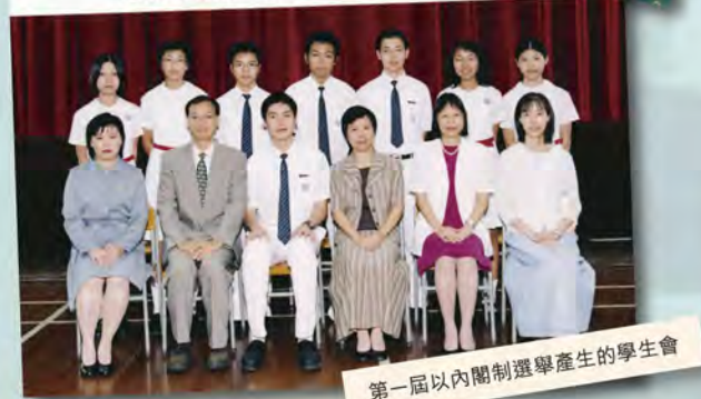
第一屆以內閣制選舉產生的學生會