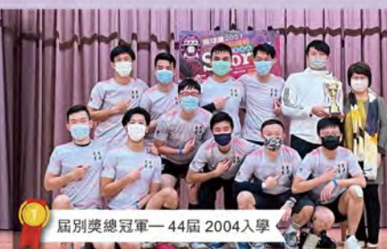
屆別獎總冠軍 - 44屆 2004入學